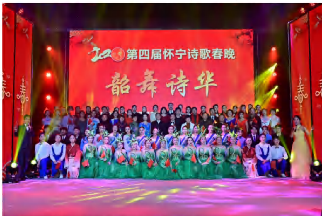
2020年1月13日，县图书馆联合海子诗歌研究会、县黄梅戏艺术中心举办第四届怀宁诗歌春晚