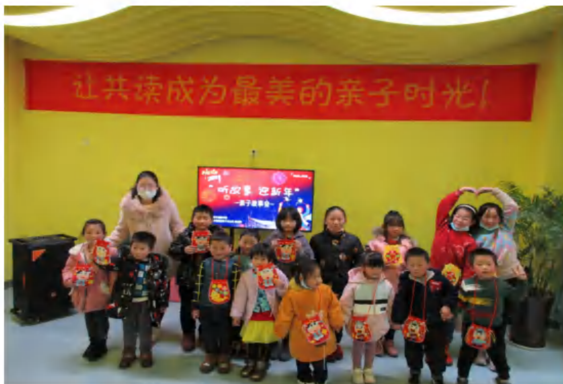
2020年12月26日，县图书馆联合博视网 开展“听故事，迎新年”亲子故事会活动