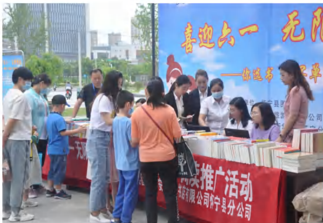
2020年5月31日，县图书馆与县新华书店联合举办“你选书，我买单”活动