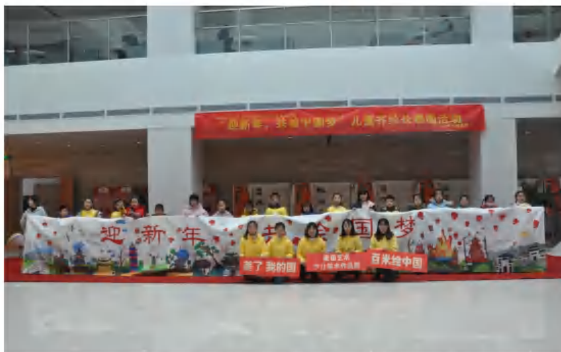
2020年1月1日，县图书馆与麦田艺术美术培训学校联合举办“迎新年，共绘中国梦”儿童齐绘长卷画活动