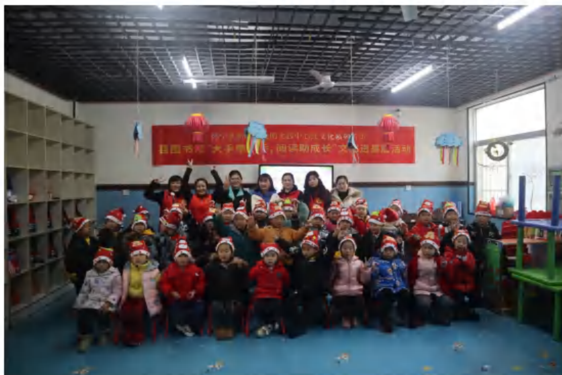
2020年12月24日，县图书馆联合县吉祥幼儿园 开展“大手牵小手，阅读助成长”活动