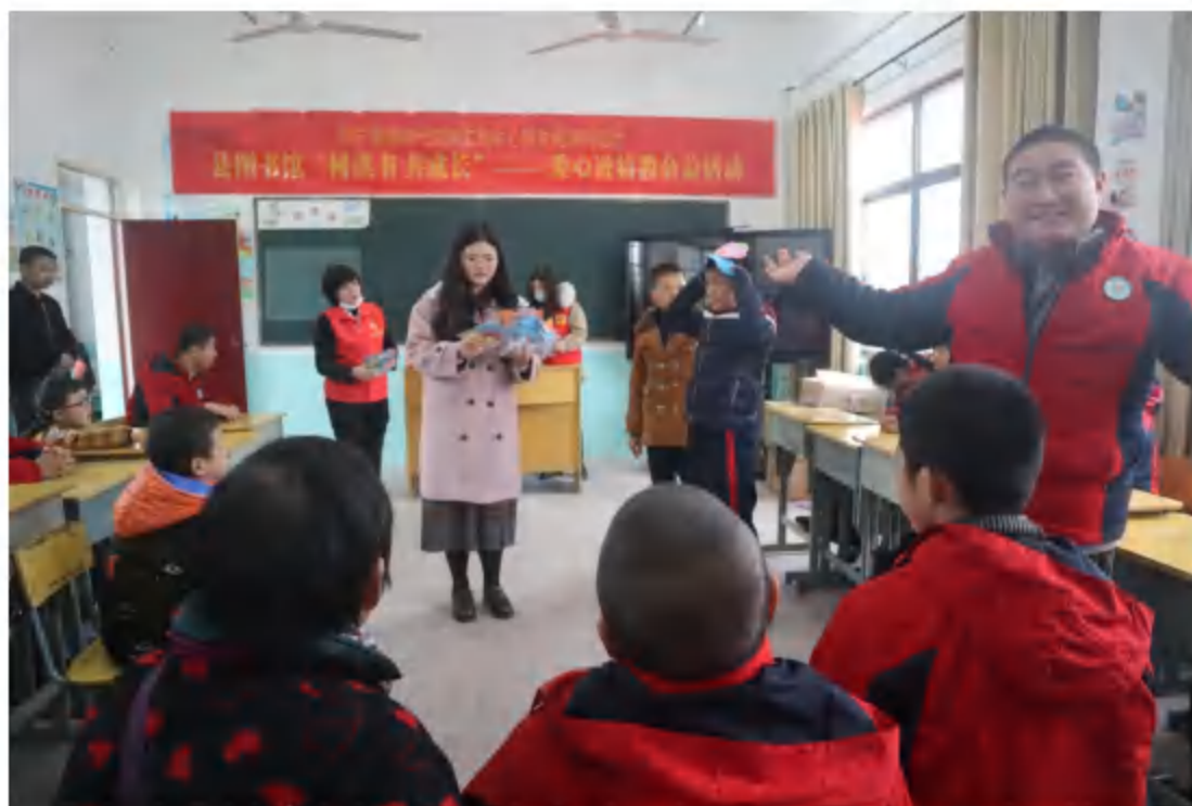
2020年11月24日，县图书馆与县特教中心联合开展“同读书，共成长” ——爱心进特教公益活动