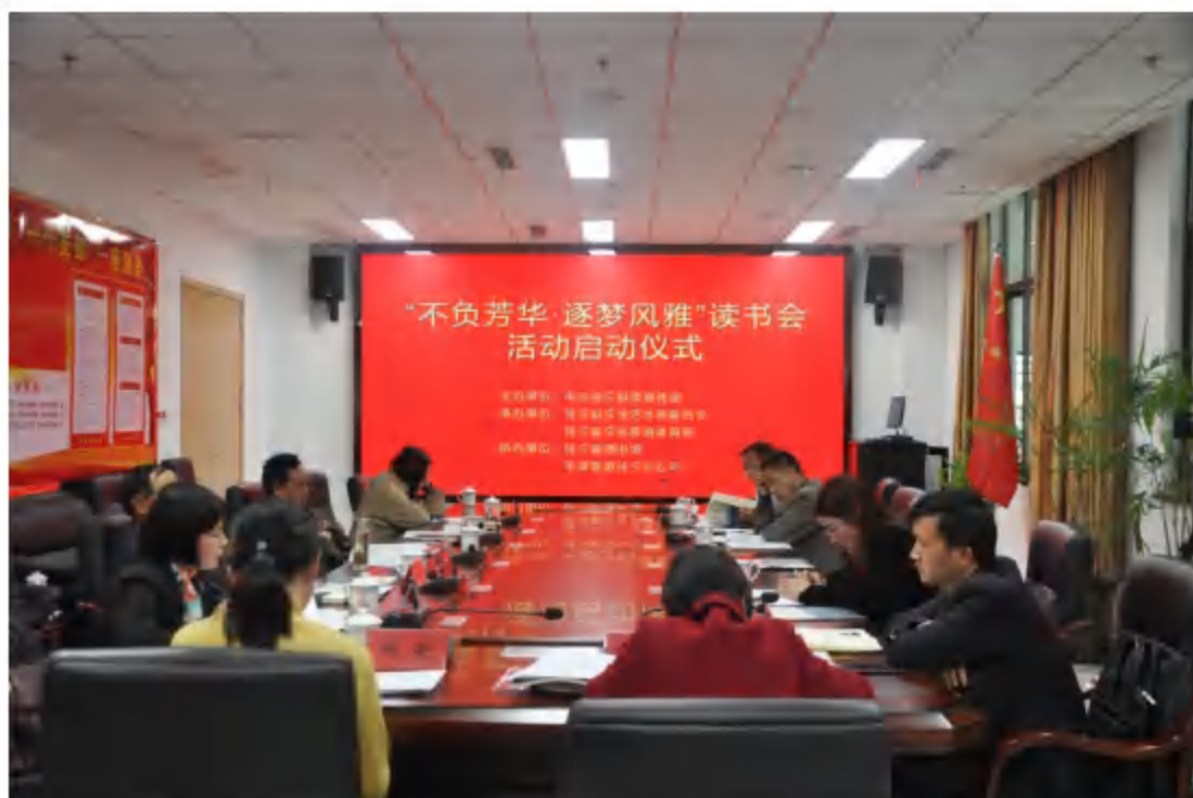
2020年4月22日，县图书馆与县文联联合举办“不负芳华·逐梦风雅”读书会