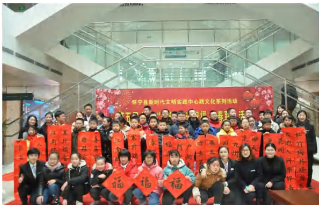
2020年1月18日，县图书馆与博艺园艺术学校联合举办第五届少儿写春联活动